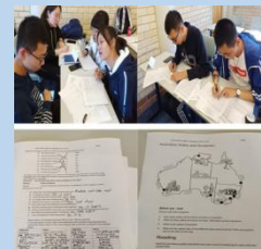
深度英语插班课程及英语测试