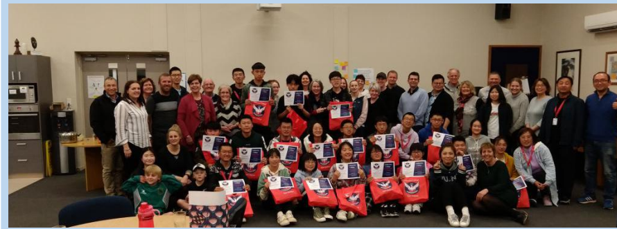
校长为大同师生颁发结业证书