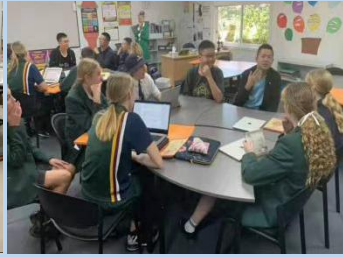
插班学习课程研究