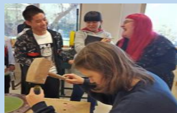
学校操作间设计实践课程