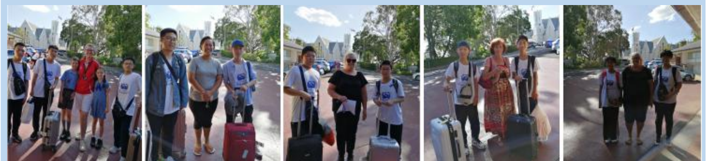
澳商会友好协作政府分配寄宿家庭

学习期间入住寄宿家庭、学生公寓或当地酒店。寄宿家庭含工作日早晚餐及周末三餐；酒店公寓不含餐（一般安排桌餐）