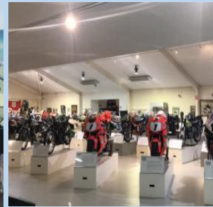
参观澳大利亚汽车摩托车博览会