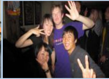
参加澳洲当地实践活动