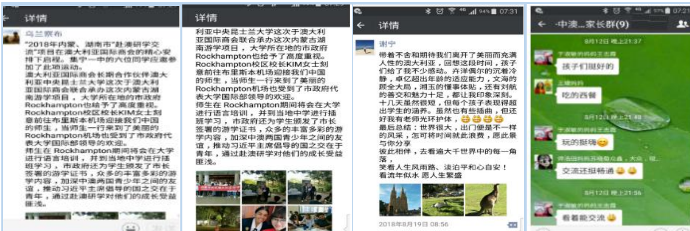
同学们怀着澎湃的心情出去，一路上开心愉悦的心情跟身在中国的学校老师、家长分享自己的见闻，收获满满