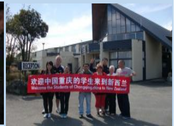
重庆工商大学参观高科工厂