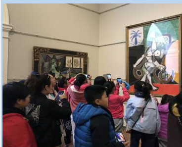
美术馆欣赏毕加索真迹