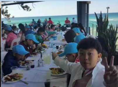
海边用西餐，开心中