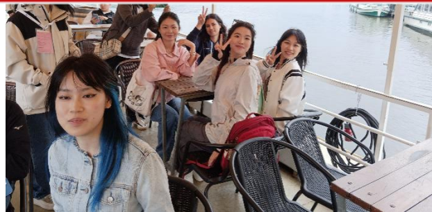
(伏尔塔瓦河游船之旅)