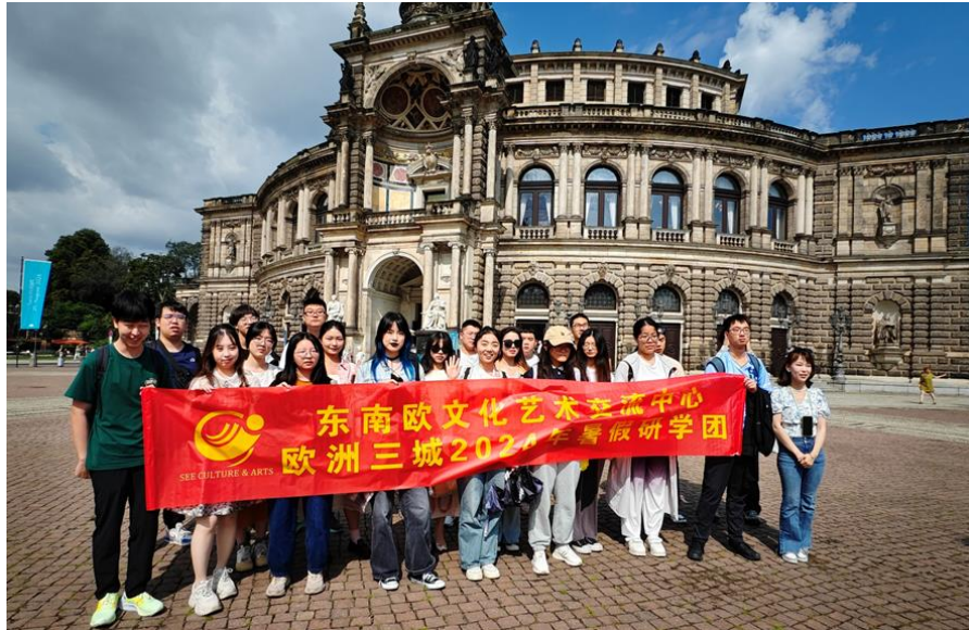
(于德国德累斯顿剧院广场，由浙江工商学院杭州商学院吴思曼老师摄影)

➤ 最佳项目竞赛优胜奖 ：根据不同的主题，以小组形式在 AI 智能工具的帮助下制作演示文稿，练习公开演讲，并进行评选，优胜者将获得奖项；