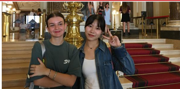
(参观捷克国家博物馆)